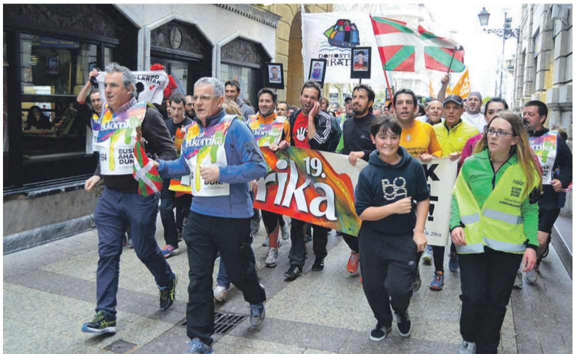
Gandarias eta Juantxo tabernetako lekukoak, Parte Zaharrean barrena.