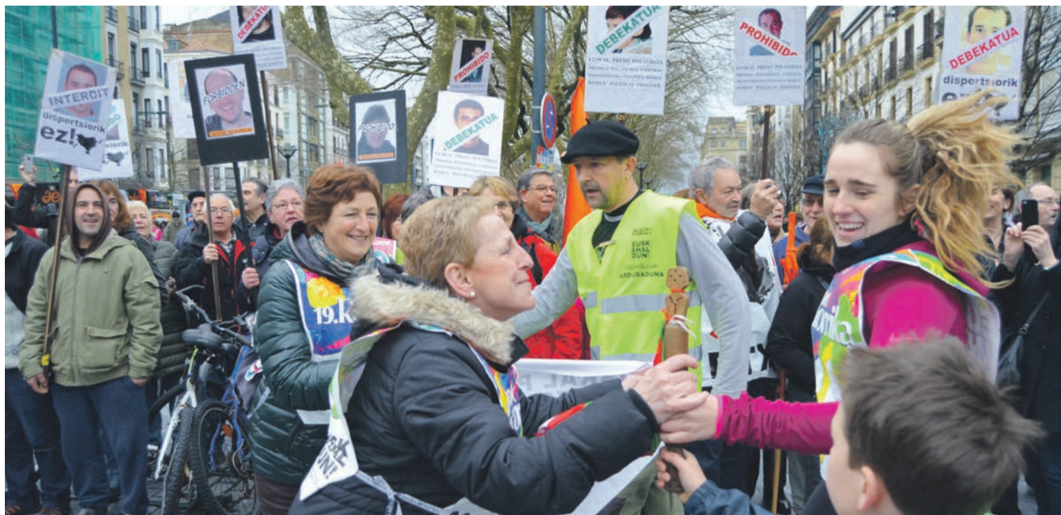
Bretxa parean, lekukoa hartzen.