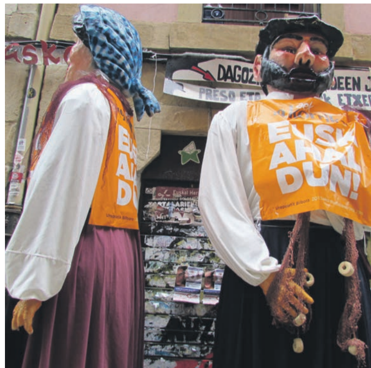
Erraldoiek ere bat egin zuten Korrikarekin. ARITZ SORZABAL