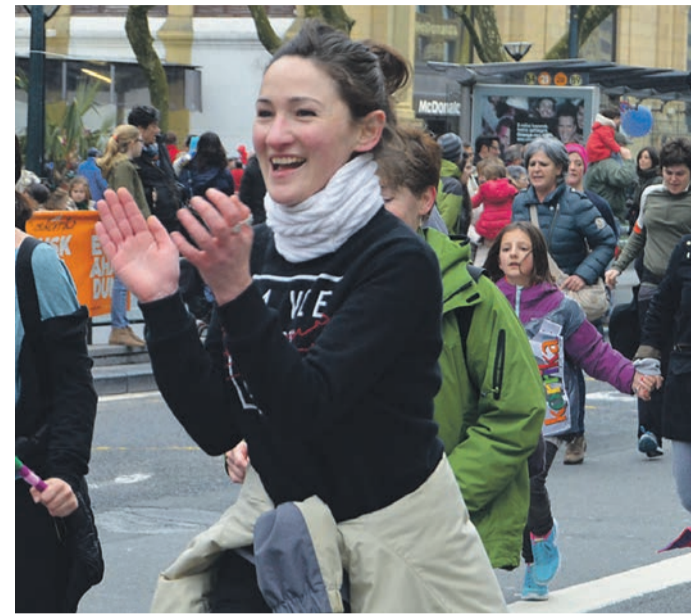
Bulebarrean, erritmoari eutsi nahian.