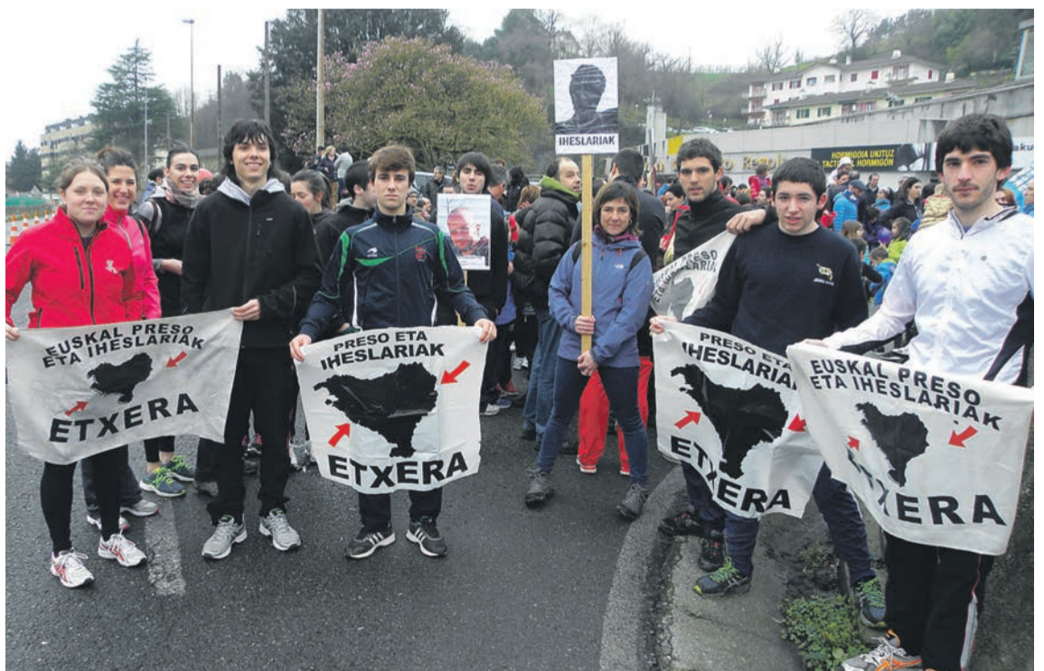
Añorgako gazte talde bat, presoen sakabanaketaren aurkako ikurrekin. ARITZ SORZABAL

Pelegrin de Urantz, 9 (Urdanibia plazaren ondoan) 20304 Irun . 943 615 184 - 687 572 920 bainu.irun@gmail.com . www.bainu.eu Zarautz hiribidea, 86 . 20018 Donostia . 943 561 652