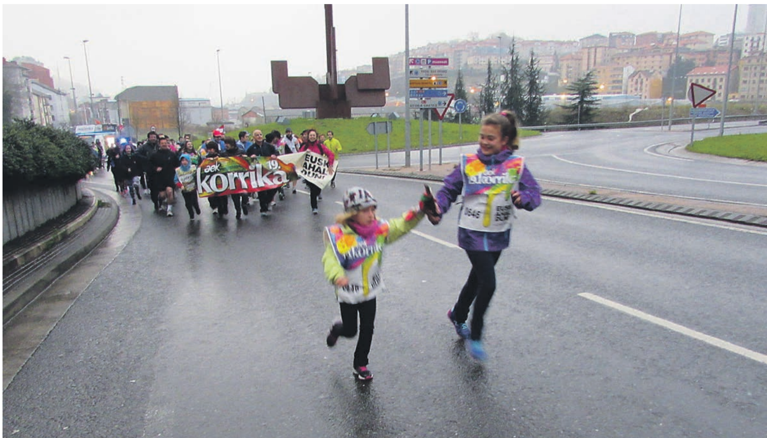
Korrikak Bidebietan egin zituen lehen metroak, Donostiari dagokionez. ARITZ SORZABAL

Eromena piztu da Donostian, Korrikaren etorrerarekin. Kaleak lepo bete dira euskararen aldeko jarduerari ongi etorria emateko. Hirian izandako irudiak errepikatuko dira etzi Bilbon, igandean iritsiko baita tropela helmugara.