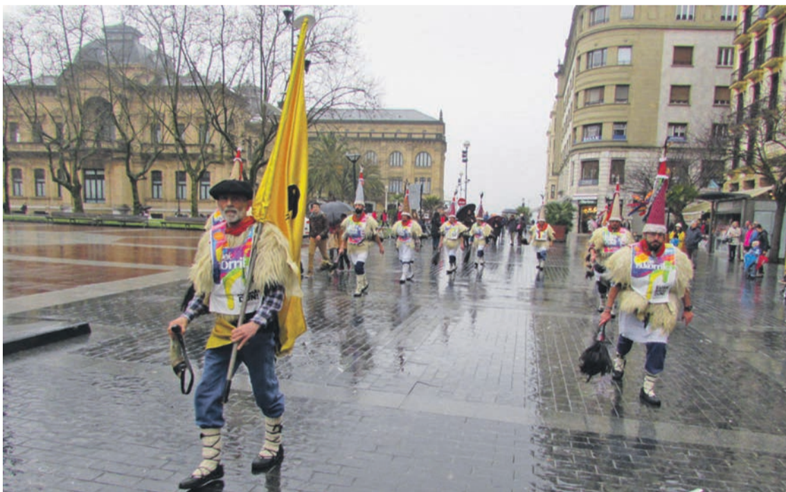
Joaldunak, larunbatean, euskararen aldeko tropelaren etorrera iragartzen.