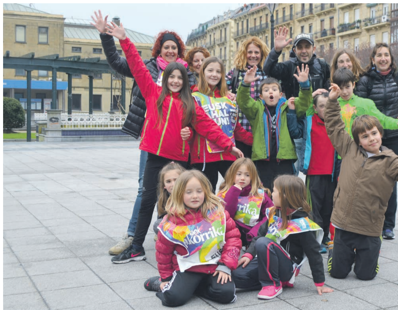
Pasai Donibanen tropelarekin bat egin ondoren, Oarsoaldeko talde hau Amarara joan zen Donostian ere