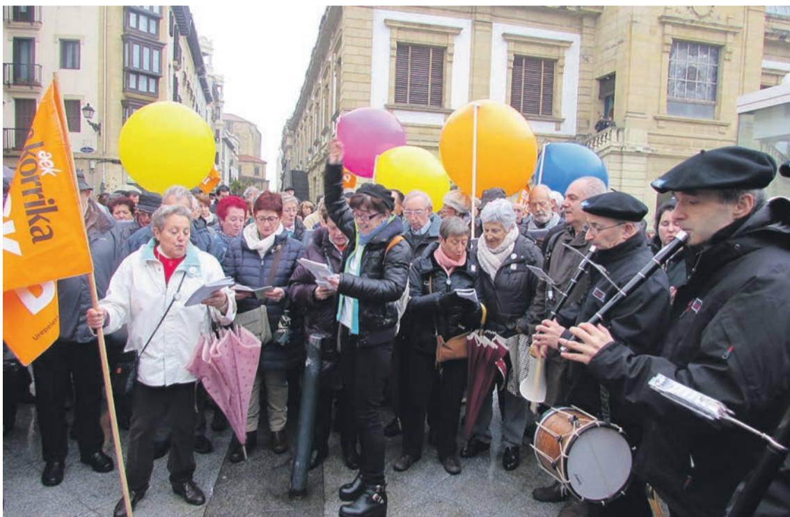
Kantu Jirak Korrikari abestu zion bezperan. ARITZ SORZABAL