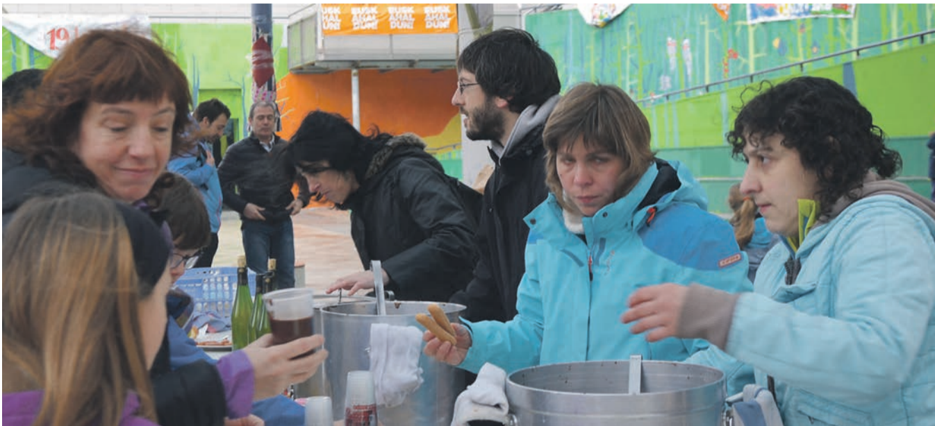
Gosariak egin zituzten auzoetan, Korrikaren zain zeudenentzat. NEREA LIZARRALDE