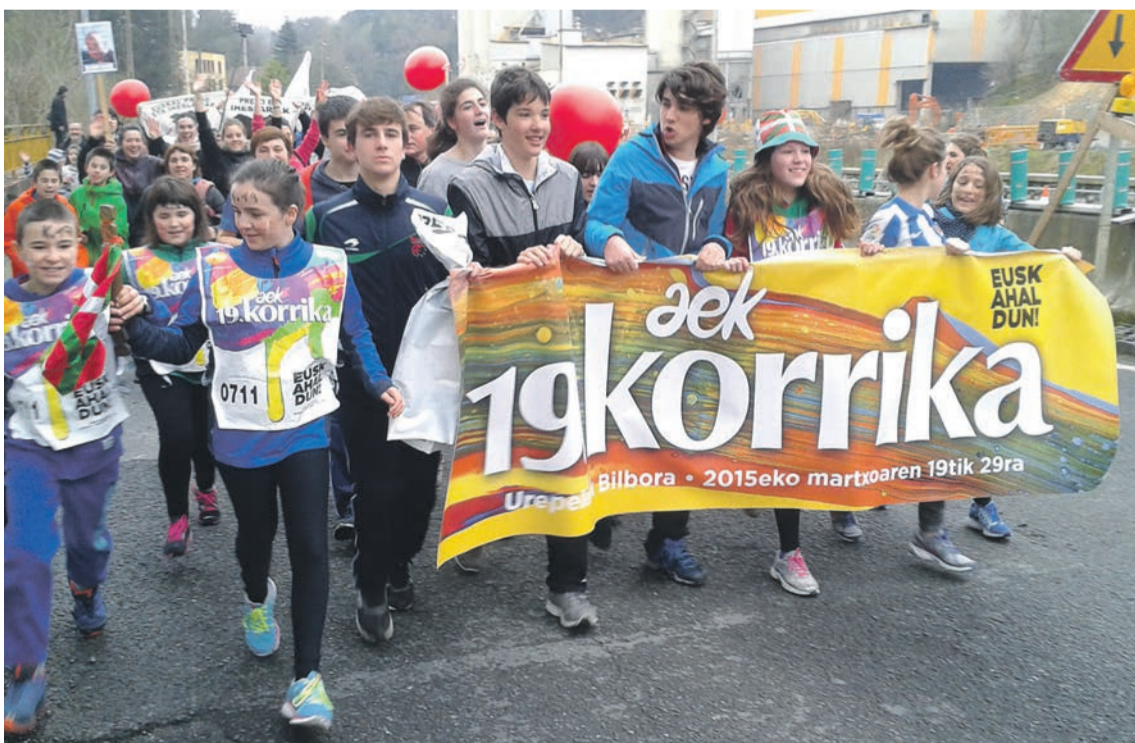
Añorgan egin zituzten Korrikaren azken metroak Donostian. ARITZ SORZABAL