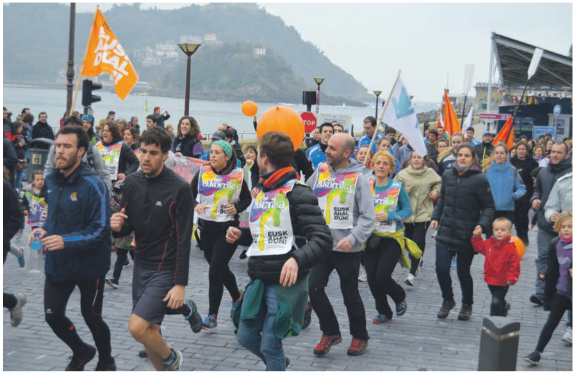
Tropela, Kaian.