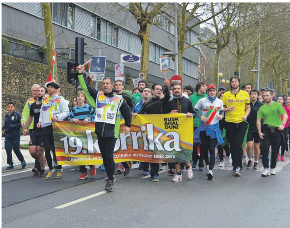
Tropela, Intxaurrendon. LIDE FERREIRA