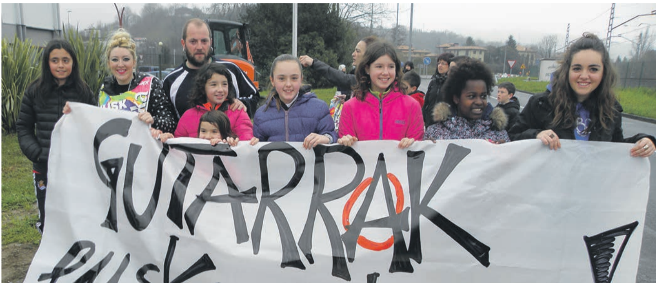
Martuteneko espetxearen parean jendetza bildu zen; Gu ta gutarrak telebista saiko kideak, tartean. ARITZ SORZABAL