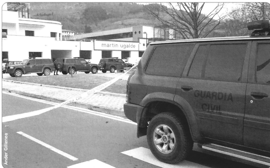
Guardia Zibilak eguerdian zigilatu zuen Martin Ugalde Kultur Parkeko Egunkariaren egoitza.