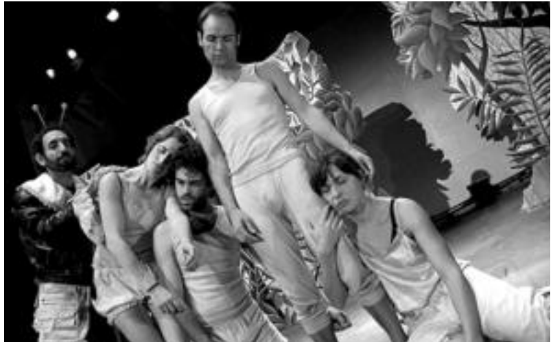
El Templek Sonetos de amor y otros delirios eskainiko du gaur Lugaritzen.

Tailerra. 13 eta 17 urteko gazteentzako topagunea. Makilaje