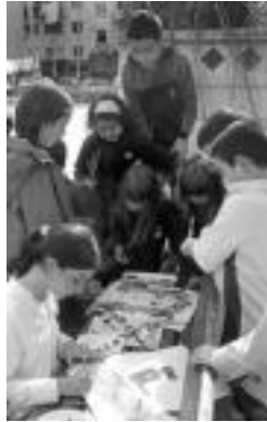
Marrazki lehiaketa iaz. R. PEREZ

▶ Non. Plaza Haundin (lanek uzten ez badute, Plaza Berrin).