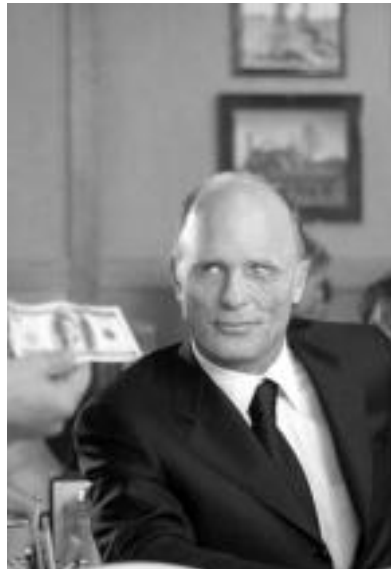
David Cronenberg A history of violence filma.