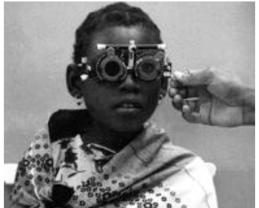
Inhabamako Begiak erakusketan ikus daitekeen argazkia.

Donostia Munduen artean ekimena berriro jarri dute abian. Elkartasun eta balio etikoetan urtean zehar lan egiten duten elkarte eta GKEk aukera dute ekimen honetan beren lanak aurkezteko. Urte bukaera arte 51 ekintza egingo dituzte. Antzezlanak, erakusketak, kontzertuak, hitzaldiak eta beste mota askotako ekimenak egingo dituzte.