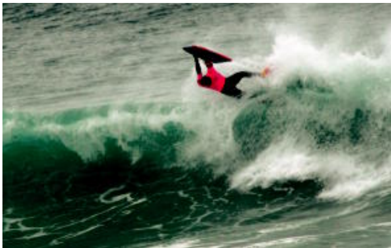
Iazko txapelketan ateratako irudia.