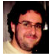
ADIORIK EZ Eneko. Internet bidez jarraitu beharko dituzu gure ibilerak. Zorte on!