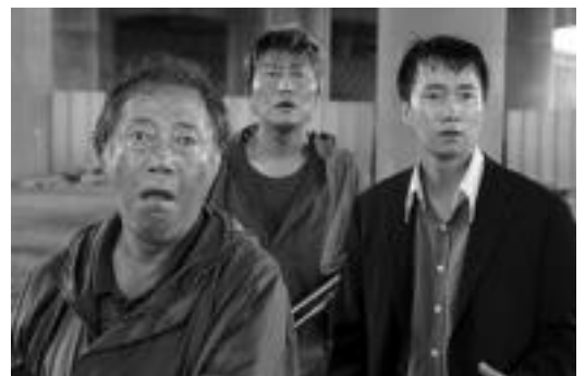
The host filmaren irudia.

Kursaalean ere emanaldiak izango dira 4ean. 17:00etan Cristobal Molon euskarazko animaziozko filma eskainiko dute. Aurtengo astearen itxiera ekitaldian The host pelikula eskainiko dute Kursaalean bertan. Bong Joon-ho zuzendari korearraren filmak oso kritika onak jaso ditu aurkeztu den jaialdi guztietan. Hainbat kritikariren ustetan, pelikula hau Tiburón eta Alien filmen ondorengoa izango da. Beraz, bukaera indartsua izango du asteak.