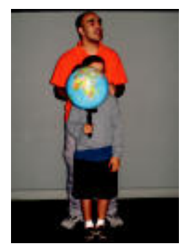
Lurraren ezaugarriak azaltzen.