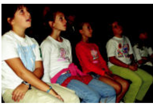
Ikasleak adi-adi Koperniko gelako pantailako azalpenak entzuten. A.I.