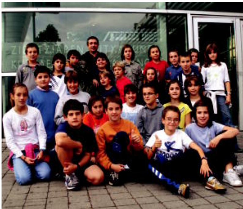
Axularreko 5.B mailako ikasleak Kutxagunearen kanpoaldean. AITZIBER IARTZA

KUTXAGUNEA ▶ Egunero hainbat ikastetxetako kideek parte hartzen dute Zientziaren Kutxaguneak antolatutako programan; Axularrekoekin egon gara