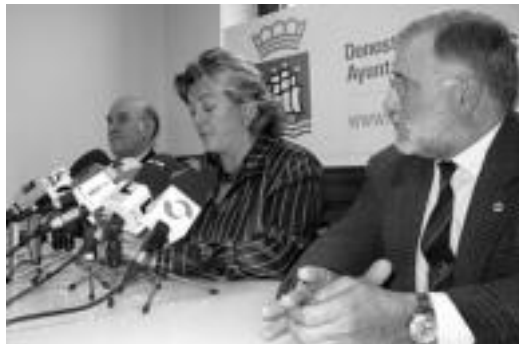
PPko zinegotziak agerraldi batetan.