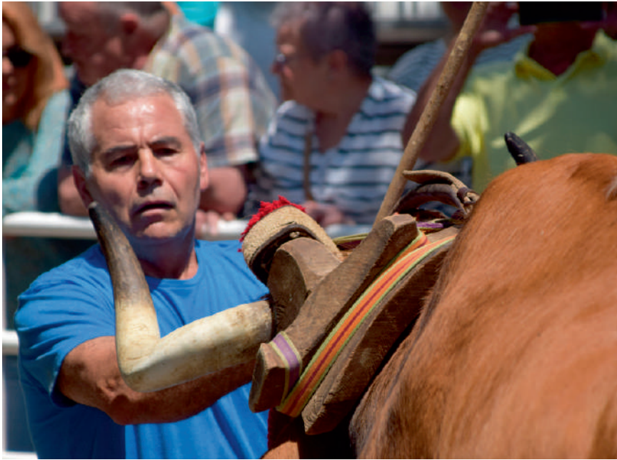
Idi demak ikusteko eta sagardoa dastatzeko aukera egon ohi da uztailaren 2an. 📺 B. PARRA