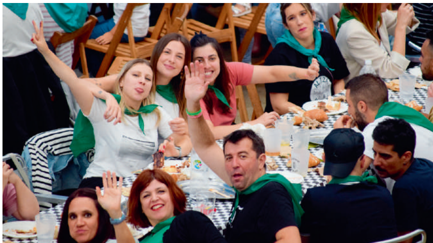
Herri bazkari jendetsua egin zuten iaz Altzako sanmartzialetan.

Azpeitiak auzoko gazteak eta Altzatarra elkarteak elkarrekin lortzen ari direna nabarmendu du: «Orain arte, ez ze inor animatzen jai batzordea eta laguntzera, eta aipatu nahi dut elkarteari erraztasuna ematen digutela nahi duguna egiteko, eta Altzako gazte batzuk buru-belarri sartu direla jai batzordean. Elkarlanerako jarrera aktiboa dago, nahiz eta adin desberdinetako jendea egon». ●