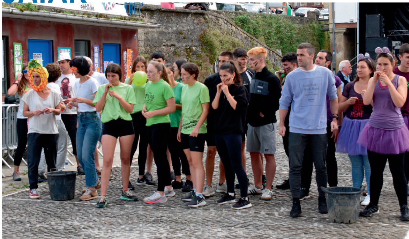
lazko Umore Horia txapelketa, Igeldoko jaietan.