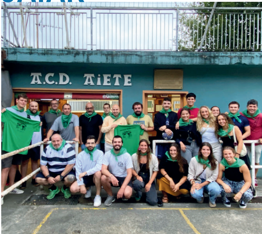
Indarrak batu eta elkarlanean aritzeko asmotan, auzoko hiru elkartet bat egin dute.