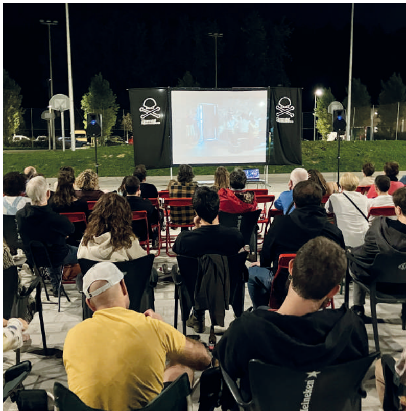
'Bizkarsoro' filmaren proiektzioa antolatuta zuten Zinemaldi Alternatiboan.