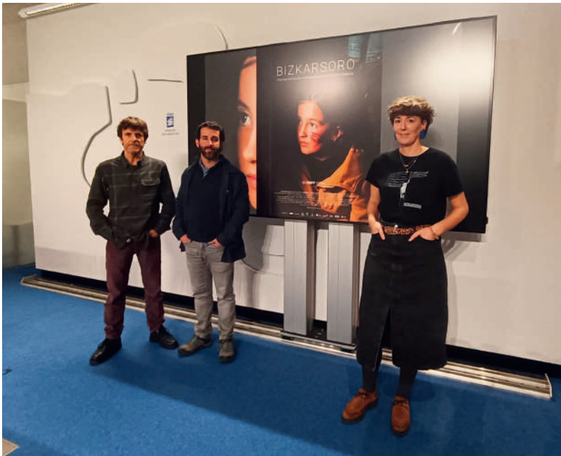
'Bizkarsoro' filma Donostiako zinema areto komertzialetan ematen ari dira.

aurretik klasean landu dezaten, filma ondo ulertzeko; euskararen egoeraren eta horren aldeko borrokaren bilakaera nolakoa izan den ulertzeko.