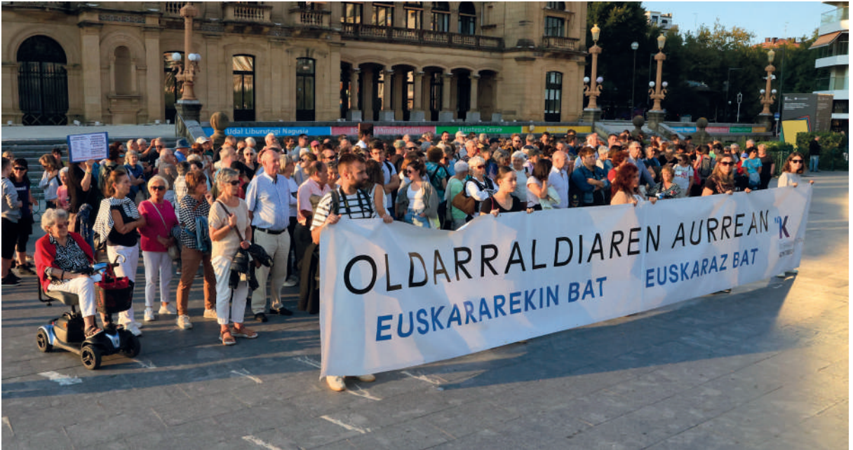
Euskararen aurkako oldarraldi judiziala salatzen elkarretaratze bat.

erlatiboa edo ezagutza maila ona edukitzea oso garrantzitsua dela uste dugu. Orain arte, galdegin izan dugu dagoen ezagutza mailarekin nola egon daitekeen dagoen erabilera maila. Horren harira, Iñaki Iurrebasok egin duen tesian argi gelditu da erabilera indartsua izateko gaitasunak ona izan behar duela. Eta, gaitasuna ona da egun, baina hemen bi hizkuntza izaten jarraitzen dugu, eta, jende gehiena beste hizkuntzan hobeto moldatzen da, euskararen baino. Horri gehitzen badiogu gero eta etorri berri gehiago ditugula eskoletan, eta horientzako zein beste askorentzako eskola dela euskararen erabiltzeko espazio bakarra,