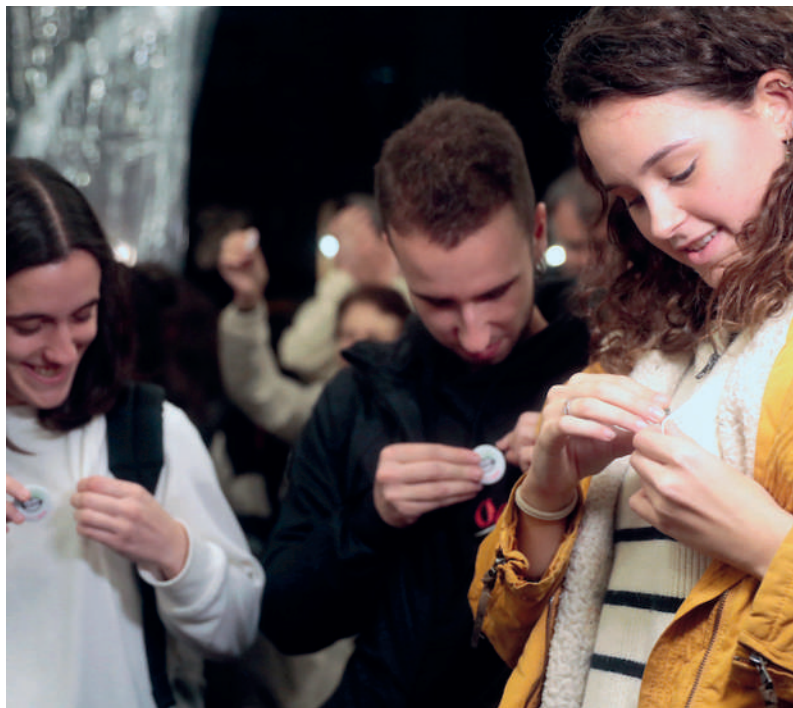
Hainbat herritar, Euskaraldiko txapak soinean jartzen. JOSEBA PARRON