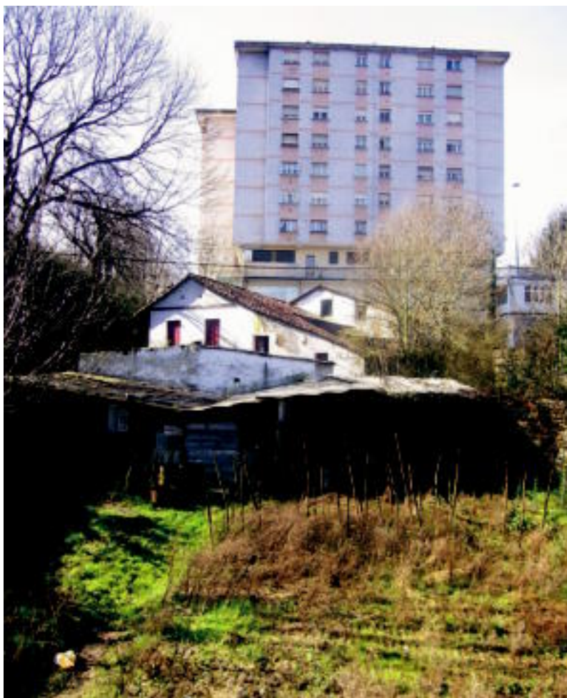
San Luis plazako Peruene baserria; Herrerako azken baserria. RAUL PEREZ

PENA ▶ Herreratarrek pena agertu dute; makina bat alditan Peruenera esne bila joandakoak dira asko ▶ 3