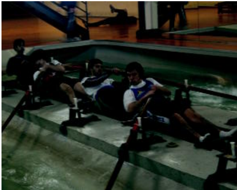
Urkiarra arraunlari gazteak jo eta ke arraunean, Loiolako egoitzako ur putzuan. AMAIA PORTUGAL

Urriaren hasieraz geroztik ari dira lanean Urkin, astean sei egunetan. Astelehene, ostegun eta ostiralean lan fisikoa egiten dute: korrikaldiak eta ergometroa, eta pisuak, bi egunetan. Ordu eta berrogei minutuko saioak, gutxi gorabehera. Astearte, larunbat eta igandetan, uretara ateratzen dira, lan teknikoa egitera. «Oso jende