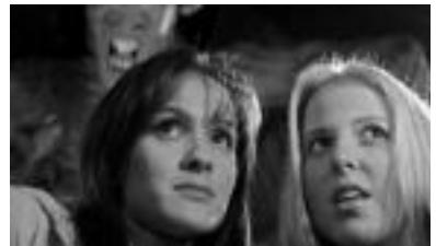
Destino Final 3 filmaren irudia.

▶ Thai Dragon 18:30 20:30 22:30 ▶ Volver 16:30 19:15 22:00 ▶ Memorias de una geisha 19:00 ▶ La pantera rosa 16:00 18:00 20:00 ▶ Destino final 3 16:10 18:20 20:30 22:30 ▶ Date movie 16:15 18:10 20:15 22:20 ▶ Brokeback mountain 22:00 ▶ Syriana 16:30 19:15 22:00 ▶ Bambi 2 16:45 ▶ Tristan e Isolda 16:45 19:15 22:10 ▶ El nuevo mundo 16:15 22:00