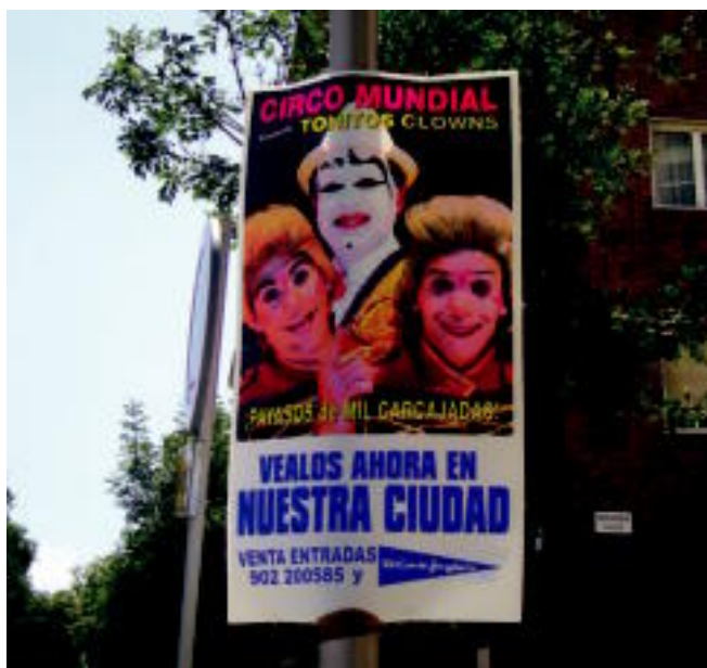
Zirkuek gaztelania hutsez jarri ohi dituzte iragarkiak Donostian. NAGORE IRASORZA

BEGIAK ZABALIK. Begiak irekiz gero, oso zaila izaten delako zirkuen kartelak ez ikustea. Handiak eta ikusgarriak izaten baitira. Badaezpada, Batzen elkarrekin ohartarazi egin ditu udal arduradunak. Hortaz, egunotan, Txinako Zirkua Nazionalak kartelak, iragarkiak eta antzekoak jartzen baditu, haietan