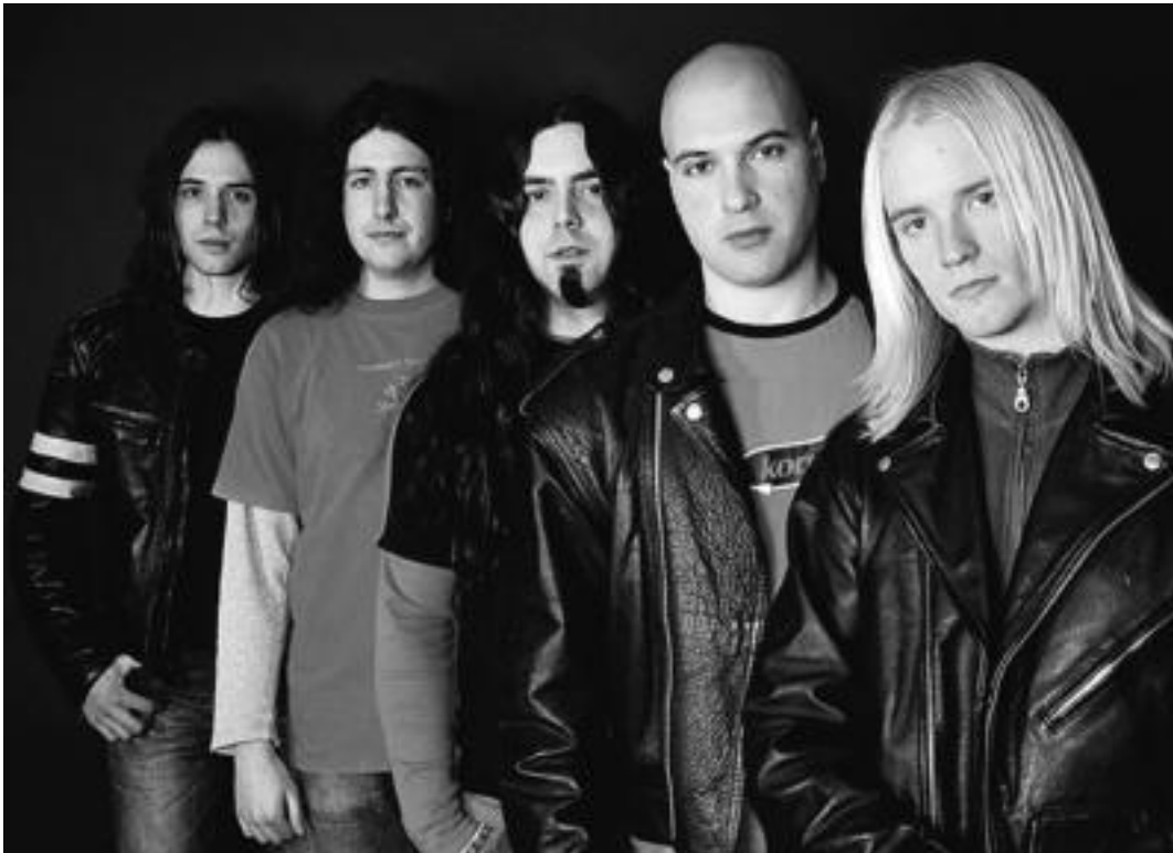
Donostiako Azken Garraisa taldeak parte hartu du Ortots zigiluak kaleratu duen lehen lanean, 'Altzairu gorria' bilduman.