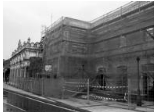
Eskaileren eraikina berritzen ari dira orain.

tan; igogailua jarri zuten, ezin- duak edota haur kotxeekin da- biltzanek nasa batetik bestera errazago joateko.