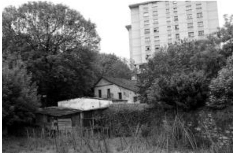
Herrerako San Luis plazako Peruene baserria. Atzean, Peruene-Berri etxea. Gaur egun ez du lur askorik, baina garai batean baserriko lurak oso zabalak ziren.