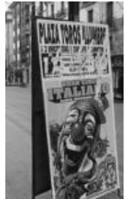
Zirkuaren kartelak, gaztelaniaz...l.

Ildo horretatik, berriz ere gauza bera gerta ez dadin eta donostiarren hizkuntz eskubi-