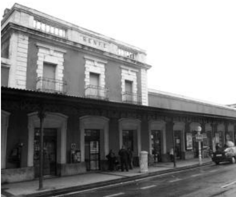
Tren geltokiaren kanpoko itxura ez da aldatuko, baina barrukoa bai; erabat, gainera. R. PEREZ

Egiara joateko eskaileren eraikina berritzen ari dira orain; jatetxea jarriko dute bertan, beheko solairuan